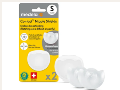
Photo: bout de sein medela