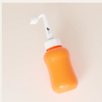
Photo: douchette vaginale périnée