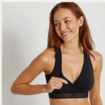
Photo: brassière d'allaitement

1 grande serviette de bain 3 petites serviettes